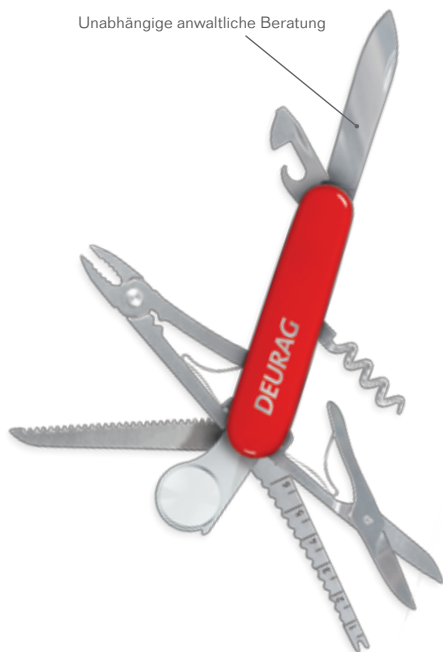
Unabhängige anwaltliche Beratung

Es muss nicht immer zu einem langwierigen Rechtsstreit kommen, wenn zwei Parteien unterschiedliche Auffassungen vertreten. Oft genügt schon eine kompetente telefonische Beratung durch einen erfahrenen Rechtsanwalt.