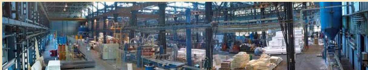
Produktionsstätte in Katar

Privilegierte Investition, gemeinsam mit Mitgliedern verschiedener Königshäuser am Golf - mit Sondergenehmigung von ADIH | Abu Dhabi Investment House